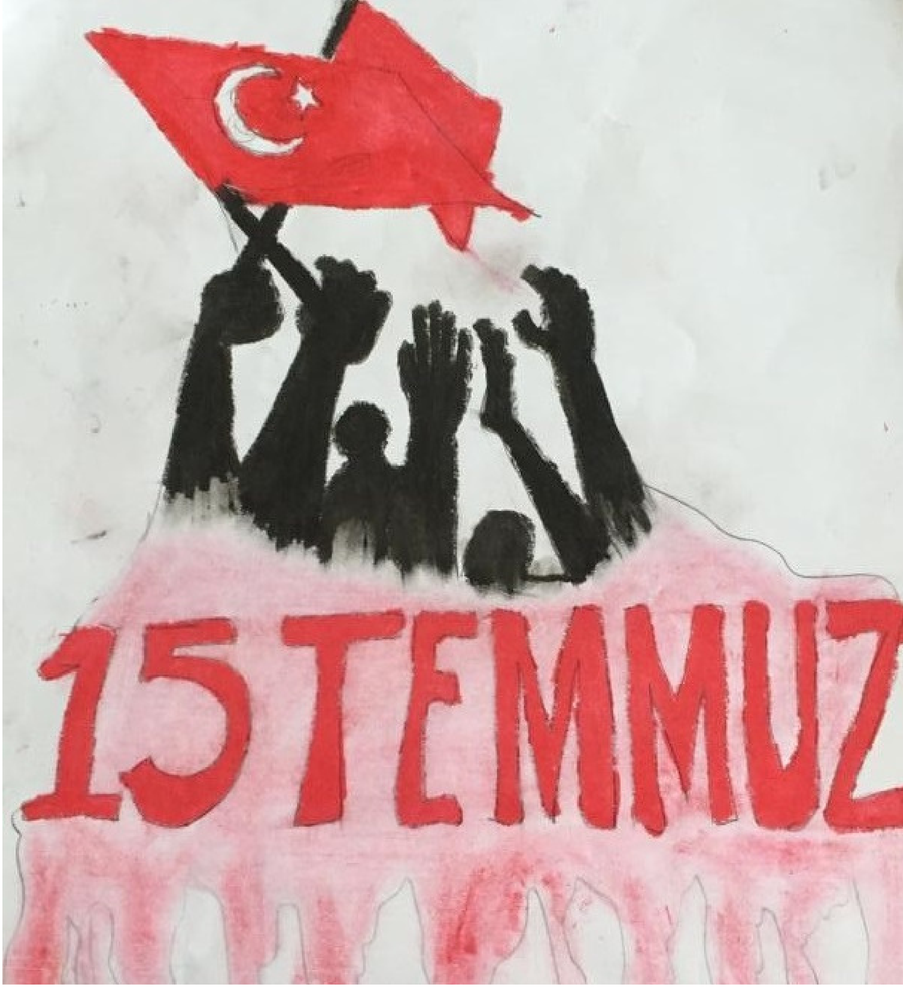
Yaren Sultan İMGA 5/F