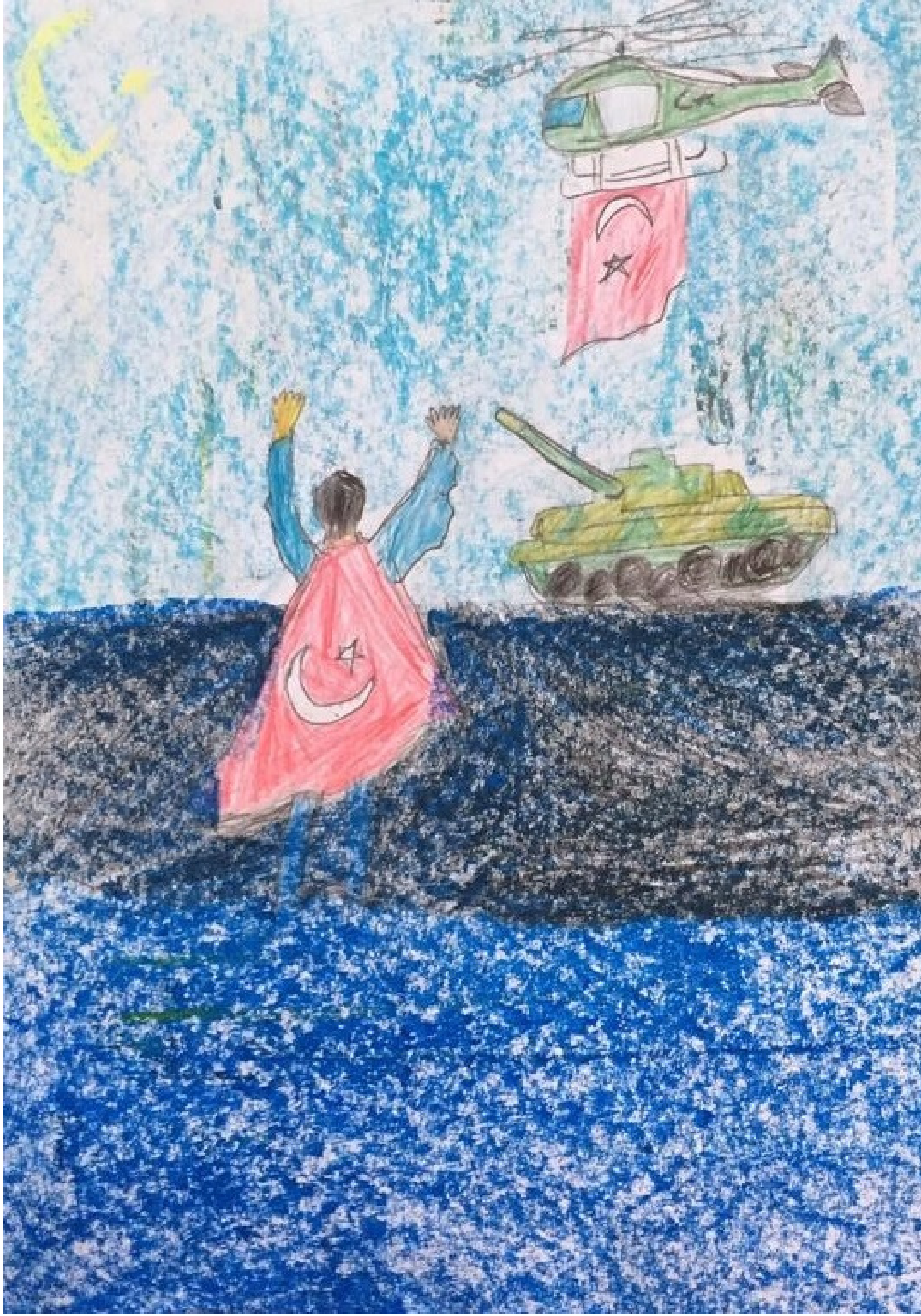
Aziz Çağın KOVANCI 5/F