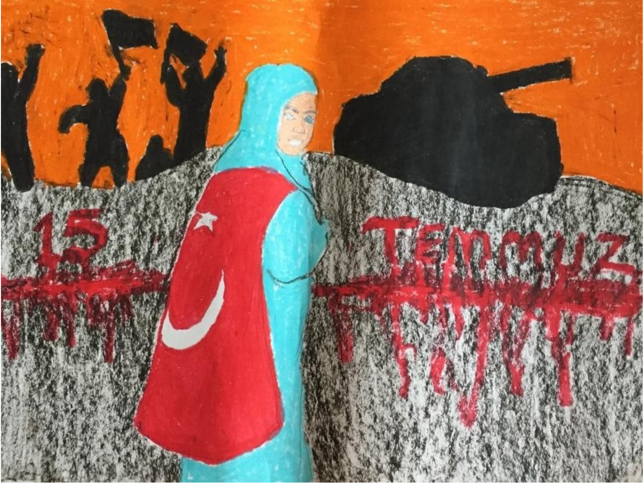
Azra ALYAZ 5/F